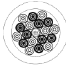
Position des pions au départ

Disposition des pions au départ : Au centre le pion rouge (la reine) ; disposé en « Y » 6 pions blancs ; en « V » 3 fois 3 noirs dans les trois angles de l'« Y » puis un blanc pour combler les « V ».